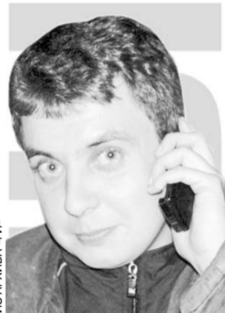
Инженер-технолог 3-ей категории.

Вопрос следующего номера: «Как Вы относитесь к градостроительной политике в Гатчине? Вызывает ли у Вас беспокойство строительство супермаркетов на Въезде, уплотнительная застройка исторической части города и т.д.» *