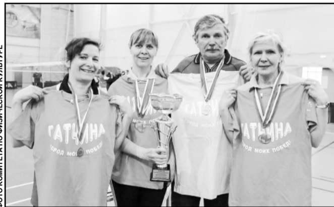
ФОТО КОМИТЕТА ПО ФИЗИЧЕСКОЙ КУЛЬТУРЕ